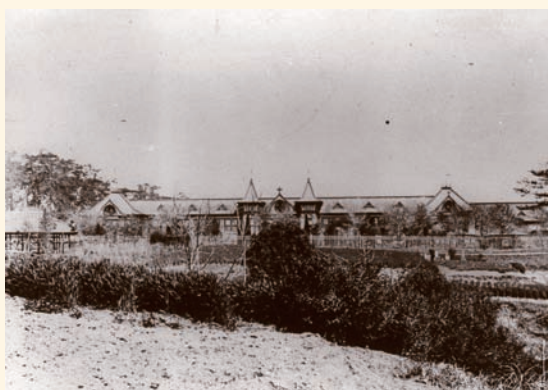
▲ 竣工当時の旧茨城県立土浦中学校

「旧茨城県立土浦中学校本館」は、現在修復工事中に付き一般公開は休止しております。平成三十年三月公開の予定です。