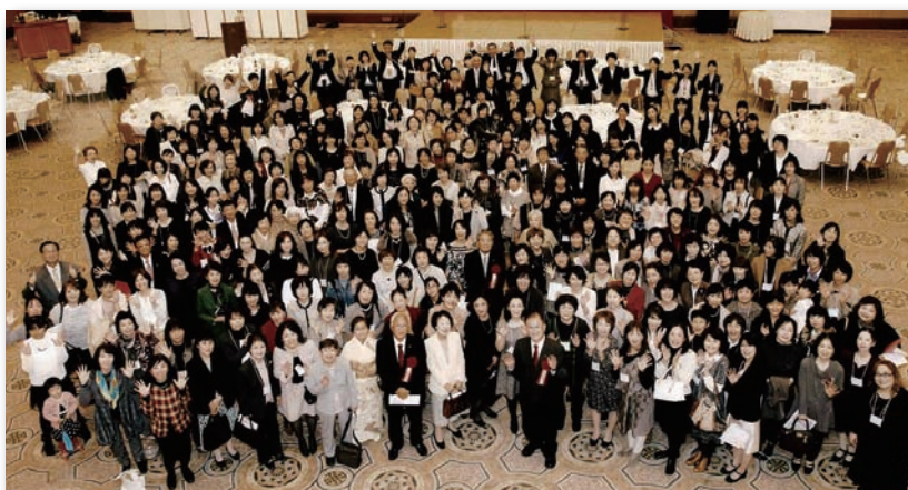
▲あかね同窓会 50 回記念祝賀会

ルとキャンパスを交互に会場として開催したいと考えています。今回、五十回記念同窓会をきっかけに、母校の五十年を振り返るDVDを作成したことで、改めてその歴史を大事にしたいという思いも湧き、多くの同窓生、歴代理事長や学長をはじめ教職員の皆様と喜びをわかち合えたことは、私にとって大変有意義であり、本当に頑張った良かったと心から思っています。協力したメンバー、そしてサラトさんや助けてくださった皆様に感謝の気持ちでいっぱいです。