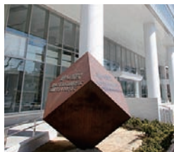
◀校舎前に設置された碑 「健への探究」

●学校法人瀬木学園は、昭和十五年（一九四〇年）名古屋市瑞穂区の現在地に瑞穂高等女学校として開校したことに始まり、現在は、愛知みずほ大学・大学院、同短期大学部、同瑞穂高等学校の四つの組織から成る。大学開学に際しては、学業にふさわしい環境を郊外に求める当時の風潮もあって豊田市にキャンパスを置いたが、その後の学生数の減少などもあり、より魅力ある学園を目指して平成二十五年（二〇一三年）名古屋市内の高等学校と短期大学の敷地に統合新校舎を建設し移転した。 このキャンパス移転に伴う学園のイメージアップ作戦と、充実した教育と就職支援の態勢、同窓会による学校支援の実際を関係する方々に聞いた。