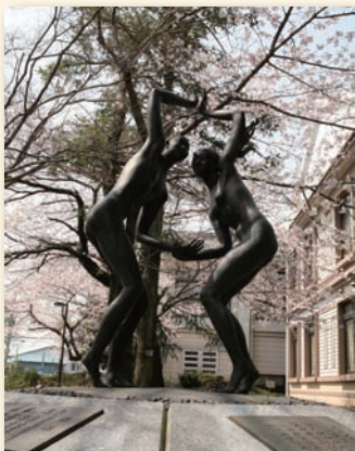
▲ 100周年を記念するブロンズ像

この旧本館のたたずまいはユニークで、かつ時代を感じさせることから、NHKドラマ『白洲次郎』や『坂の上の雲』などのロケ地ともなった。