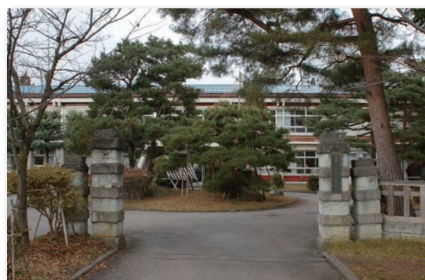
▲喜多方高等学校正門

場から学校の様子を伝える」コーナー、第三に「生徒自身による文化・運動などの活動状況の報告」といったところです。最後のコーナーは生徒会の放送委員会が取材・録音し「FMきたかた」に送っていますが、番組の全体的な構成、取材、インタビュー、録音、編集は「FMきたかた」にお願いしています。 同窓会活動としてFMラジオを活用しようと考えた背景には、第一に、生徒が先輩から続く喜多方高校の歴史と伝統を深く認識してほしいという同窓会としての基本的な考えがまずあります。それと近年叫ばれている「少子高齢化」に伴う生徒数の減少に何らかの形で歯止めをかけたという願いがあったからです。このところの会津地域の人口減は顕著でして、喜多方市の人口も五万人になりました。二年ほど前の一学年二百四十名が現在では二百名、一クラス減です。手をこまぬいていけば、この傾向に拍車がかかる一方だという危機感が学校と同窓会双方に強くあり、両者が緊密に協力すべきだという認識のもと、色々とし恵を絞った末に考え出されたのがこのラジオを使ったPRです。これは広報委員会で議論のうえ企画が立てられ総会で議決、実行されたものです。