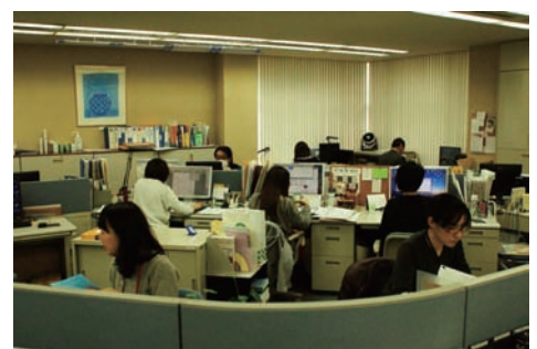
▲同窓会報作成チーム

サラトは昨年（平成二十七年）、全国百七十八校の同窓会名簿を納品させていただきました。発行にご協力をいただきました同窓会・学校・会員の皆様、心より御礼を申し上げます。